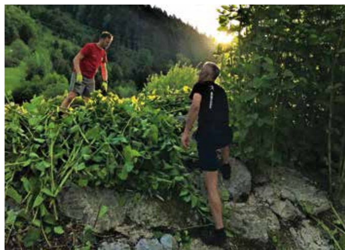
Odstranjevanje japonskega dresnika v Račevi maja lani

V Občini Žiri so o nevarnostih invazivk v preteklosti že ozaveščali v okviru projekta Ljudske univerze Škofja Loka Aktivno proti invazivkam. »Sama ozaveščenost brez ukrepanja na terenu pa invazivk ne ustavi, zato se nadaljujejo aktivnosti za doseg tega cilja,« je poudaril Šubic. Tako v prihodnje načrtujejo osvežitev občinske spletne strani o invazivkah, občanom pa bodo ob skupinskih akcijah odstranjevanja invazivk pomagali z embalažo in odvozom. Po Šubičevih besedah je tudi ravnatelj osnovne šole prijazno sprejel njegov predlog, da učencem razdelijo letake o invazivkah, o tej problematiki in potrebi po ukrepanju pa so se pogovarjali na razrednih