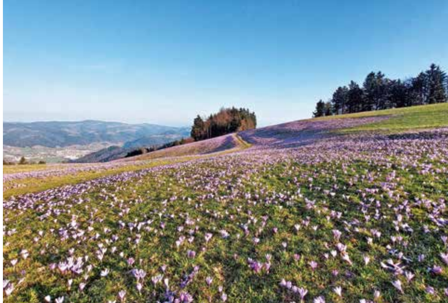
Žafrani so obarvali pašnike okoli Loncmanove Sivke.

V PD Žiri si želijo, da bi se jim na njihovih organiziranih izletih in pohodih pridružilo še več udeležencev. Zato so člani skupaj z vabilom na zbor članov prejeli tudi načrt planinskih aktivnosti, ki jih letos pripravljajo vodniki PD Žiri. V marcu so vodniki PD Žiri že uspešno izvedli izlet na Lisco, 21. aprila pa se odpravljajo na dvodnevni izlet v Paklenico. Dne 12. maja se jim bo mogoče pridružiti