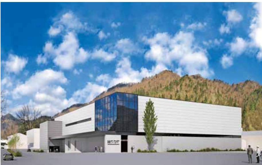
Novi visokotehnološki center električne mobilnosti v Spodnji Idriji / Foto: arhiv podjetja

in jih naši zaposleni tudi živijo. Takšnih sodelavcev bi si želeli tudi v prihodnje. Mi jim ponujamo konkurenčni sistem nagrajevanja in višje plače, kot so določene v panožni kolektivni pogodbi. Izplačujemo tudi regres, ki je visoko nad minimalnim, prav tako pa tudi božičnico oziroma izplačilo poslovne uspešnosti. Velik poudarek