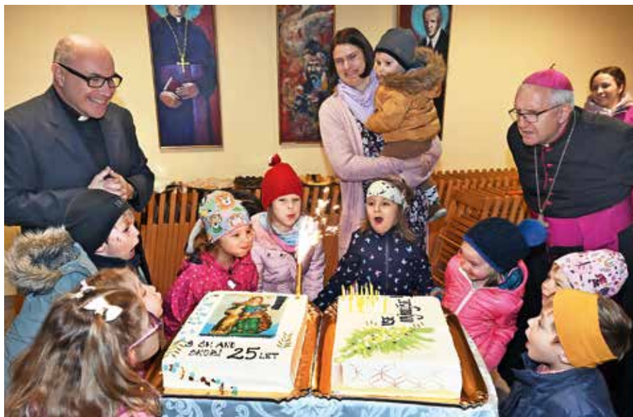
Ob vrtčevskem rojstnem dnevu so se posladkali s torto.