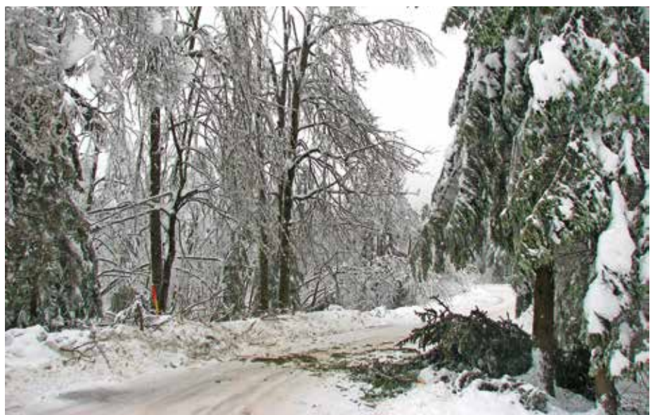
Sneg je v letošnji zimi poškodoval posamezna drevesa, kar nudi odlične pogoje za razvoj podlubnikov.

V spomladanskem času pričakujemo močno gradacijo velikega smrekovega