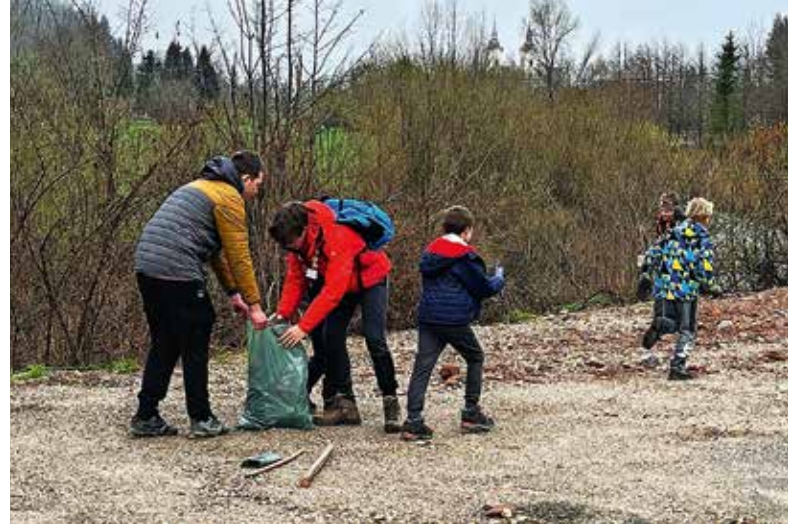
Prostovoljci so tudi letos Žiri očistili smeti.