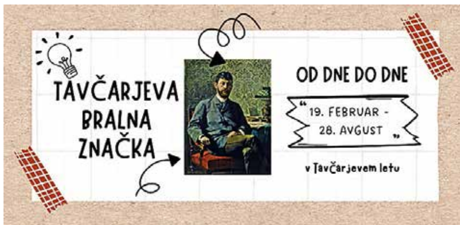
Tavčarjeva bralna značka poteka tudi v Krajevni knjižnici Žiri.

Naša knjižnica ponosno nosi njegovo ime, zato smo v počastitev spomina na bogato pisateljevo ustvarjalno zapuščino, pripravili posebno bralno akcijo in jo poimenovali Tavčarjeva bralna značka – Od dne do dne. Poteka namreč od 19. februarja, ko smo zaznamovali stoto obletnico njegove smrti, in vse do 28. avgusta, ko bomo počastili obletnico pisateljevega rojstva. S priporočilnim seznamom literature želimo vse naše bralce in obiskovalce spodbuditi k pre-