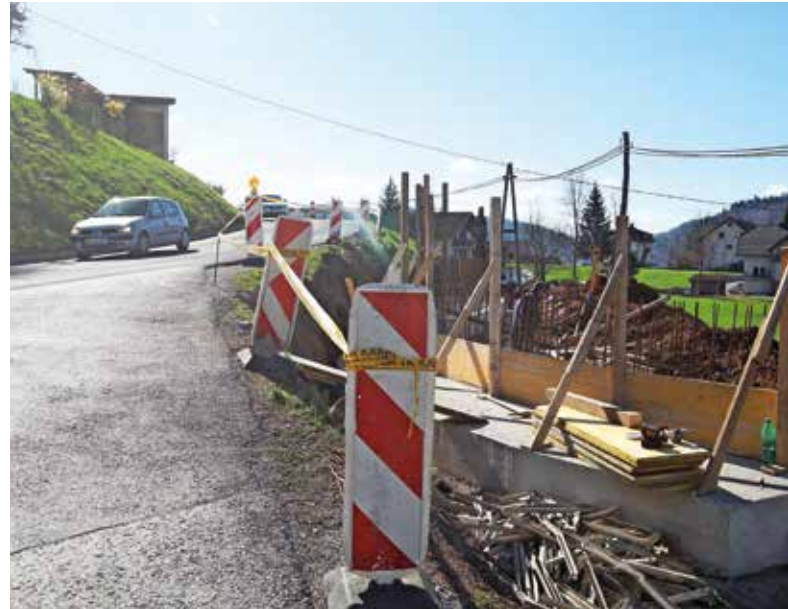
Gradnja pločnikov na Selu

Za obvoznico proti Logatcu pa od države v prihodnjih dneh pričakujejo tehnični pregled in s tem sprostitev prometa po že zgrajeni cesti. V sklopu 2,2 milijona evrov vredne naložbe so poleg novega cestnega odseka v dolžini osemsto metrov in novega križišča pri Pustotniku pridobili tudi nove pločnike in kolesarsko stezo. »Ko bo promet preusmerjen na obvoznico, bo imela Logaška cesta status občinske ceste, in ne več državne. Obenem bo ta cesta po novem prometno manj obremenjena, kar je še zlasti pomembna pridobitev, saj bo kakovost življenja ob njej zdaj bistveno višja,« je poudaril župan. Boljše prometne razmere se obetajo tudi na Selu, kjer bodo nadaljevali obnovo državne ceste in gradnjo pločnikov ob njej, z izvajalcem pa se po županovih besedah poskušajo dogovoriti tudi za vgradnjo cevi za optično omrežje. »Pogodba je že podpisana, in če bodo okoliščine dopuščale, bo cesta zgrajena še letos.« Občina bo za omenjeni projekt zagotovila 170 tisoč evrov. »Najpomembnejše je, da se uredi križišče proti Jarčji Dolini, ki je ta čas zelo nevarno, in seveda zgradijo pločniki za varnejšo pot pešcev,« je še dodal župan.