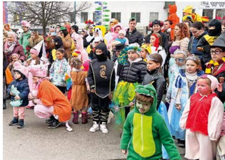
Na pustno soboto so Žiri preplavile maškare.