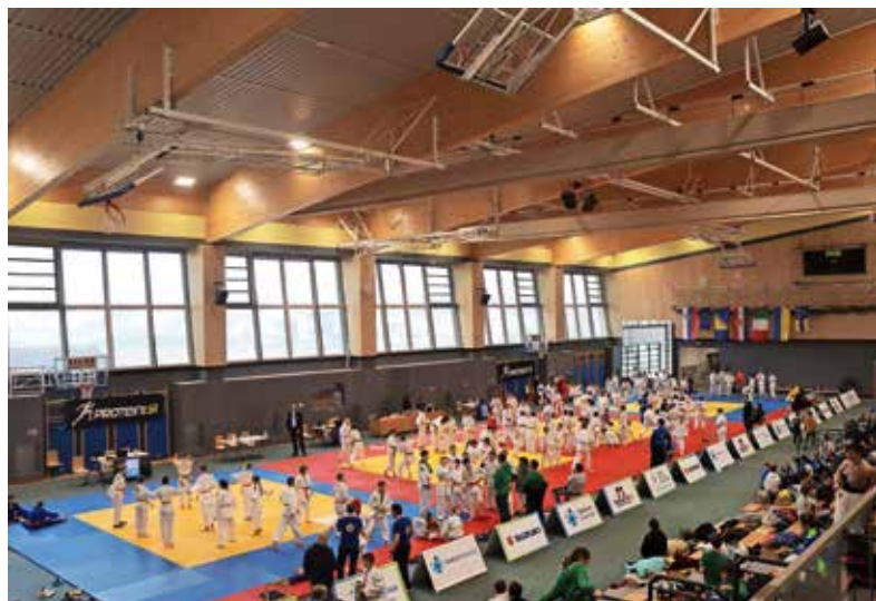
V športni dvorani v Žireh je v marcu potekal že šesti Judo pokal Žirov.