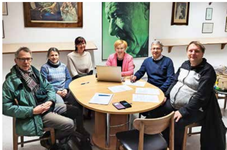
Ustanovni člani Kulturnega društva Anton Jobst