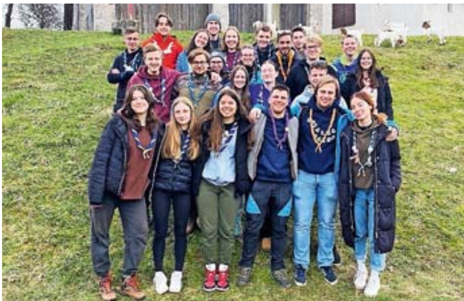
Za žirovskimi taborniki so trije pustolovščin polni meseci.

Medtem ko medvedki in čebelice pridobivajo novo znanje na področju peke kruha, pa drugi taborniki na tekmovanjih dosegajo izjemne rezultate. Kmalu po novem letu se je kar sedem skupin iz našega rodu podalo na že petdeseto orientacijsko tekmovanje Glas svobodne Jelovice, ki je potekalo v Železnikih. Na tem tekmovanju so morali naši taborniki pokazati veliko znanja, saj tekmovanje od nas poleg znanja orientacije po neznanem terenu zahteva tudi znanje prve pomoči, taborništva in bivanja v naravi. Tekmovanja so se udeležile tri ekipe gozdovnikov in gozdoznic (starostna skupina od 6. do 9. razreda osnovne šole), dve ekipi popotnikov in popotnic (od 16. do 21. leta), ena mešana ekipa raziskovalcev in raziskovalk ter grč (od 21. do 27. leta ter od 27. leta naprej), ter ena ekipa grč (nad 27 let). Vse skupine so pokazale veliko znanja in vzdržljivosti. Vod Hobotnice pa si zasluži prav posebno pohvalo, saj so dekleta osvojila prvo mesto v kategoriji gozdovnikov in gozdoznic. Na progi, po kateri so prišli s pomočjo orientacije, so dosegli najhitrejši čas in dosegli nadpovprečen rezultat na topografskih in drugih tematskih testih. Žirovski taborniki se vsako leto odpravimo na tekmovanje Glas svobodne Jelovice ter tam dosegamo izjemne rezultate. Tako so letos tudi v kategoriji